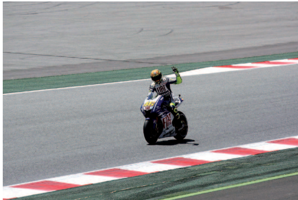
Valentino Rossi siedem razy był mistrzem świata MotoGP