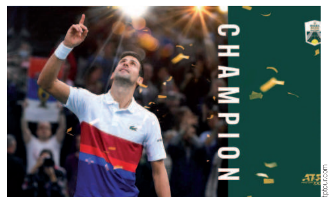
Triumf w Paryżu to dla Djokovicia 86. tytuł w karierze