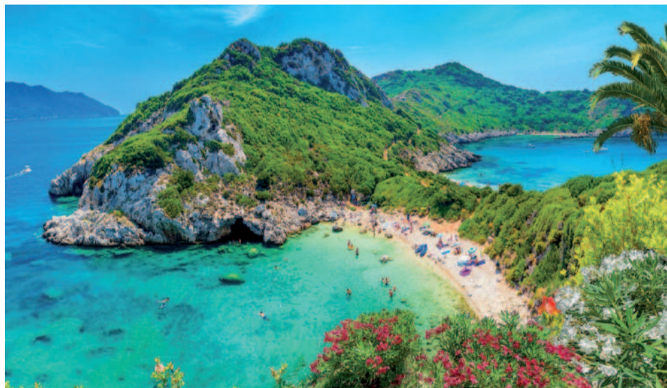
Hit sezonu- wyspa Korfu w Grecji

Pewnie wielu z was cierpi na jesienną chandrę. Spoglądając za okno widzimy szarość. Spragnieni jesteście promieni słonecznych. Siedząc w zamkniętym pomieszczeniu, czytając książkę i popijając ciepłą herbatę zaczynamy wspominać przepiękne słońce, ciepło i radość dni. Ostatnie dni wakacji. Pandemia również tego nie ułatwia. Rok 2020 był wyjątkowo trudny. Zmienił wszystko. Byliśmy odizolowani i nie mieliśmy zbyt wielu możliwości wyjazdowych. W tym roku było nieco łatwiej, ale i tak obostrzenia covidowe wstrzymywały planowanie wypoczynku. Statystyki turystyczne uległy zmianie. W tym artykule przyjrzymy się tym zmianom.