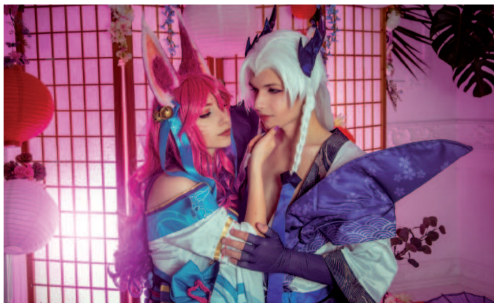
Spirit Blossom Ahri i Yone z League of Legends