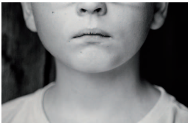
Ile młody człowiek może znieść, w imię miłości?

Już od pierwszych stron widać więc, że codzienność Shuggiego jawi się w ponurych barwach. Sam klimat powieści, choć dobrze koresponduje z wagą opisywanych przeżyć i trudnych sytuacji, może przytłaczać, a w skrajnych przypadkach nawet zmęczyć. Czy