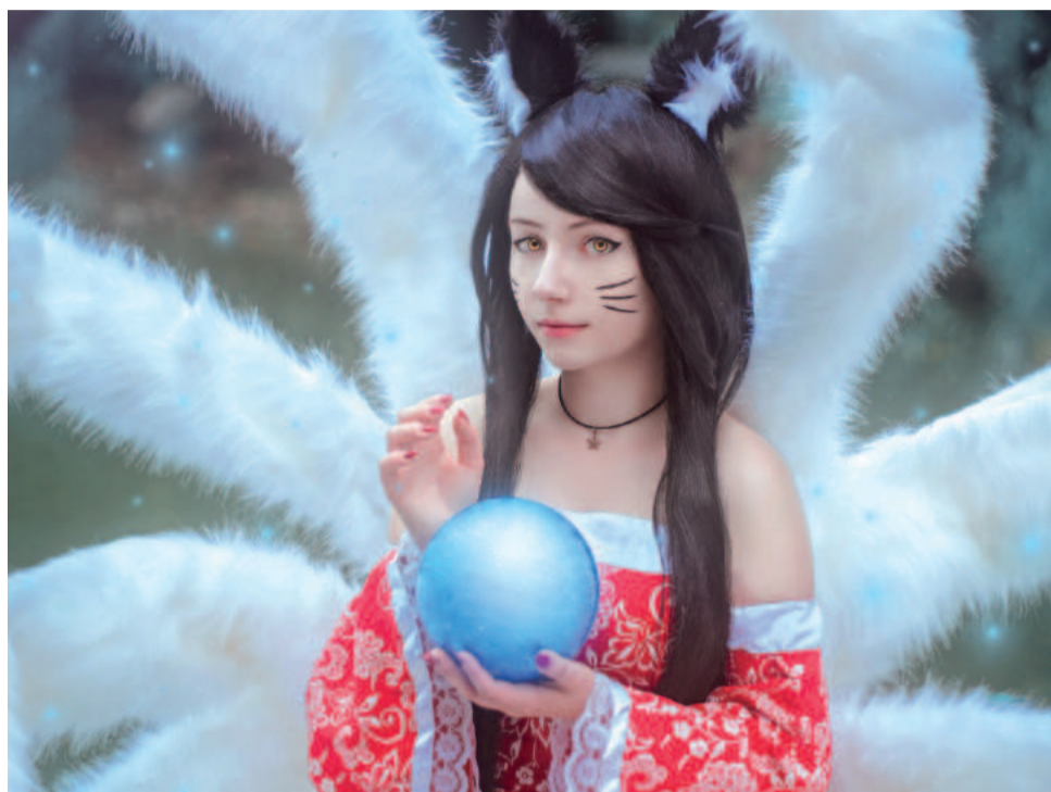
Pierwszy cosplay - Ahri z League of Legends

Pamiętam, że początkowo nigdzie w internecie ani w hurtowniach nie mogłam znaleźć materiału z odpowiednim wzorem. Ostatecznie idealna okazała się... stara, już zniszczona i pościęta sukienka. A jednak udało się z niej stworzyć coś nowego. Z kolei ogony powstały z drutu i całej masy sztucznego futerka, a przymocowane były do deseczki na moich plecach. Samo szycie trwało około trzech tygodni, ale teraz idzie mi to już trochę szybciej, bo robiąc cosplay mieszczę się w tygodniu – dwóch. Trzeba też zaznaczyć, że moje stroje opierają się głównie na szyciu. Nie są to skomplikowane, pełne zbroje, dlatego nie pracuję raczej z drewnem czy metalem. Korzystam natomiast z pianki, która jest