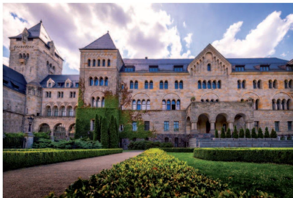
Zamek Cesarski w Poznaniu

Podczas Powstania Wielkopolskiego w piwnicach zamkowych znajdowały się kuchnie z po-