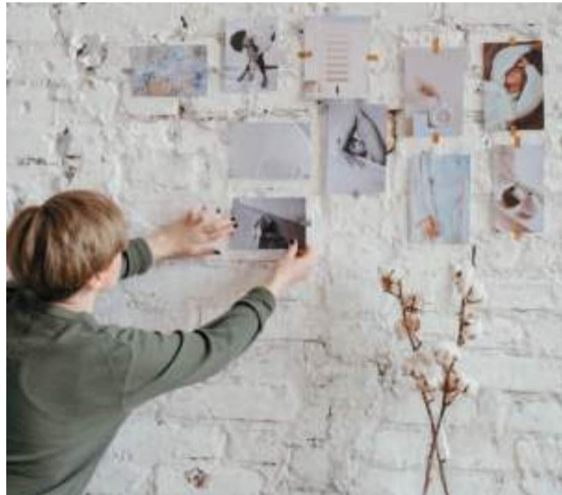
Wiele osób ucieka się do manifestacji, aby polepszyć swoje życie

nierozumianej filozofii, przekuwając ją w modny styl życia.