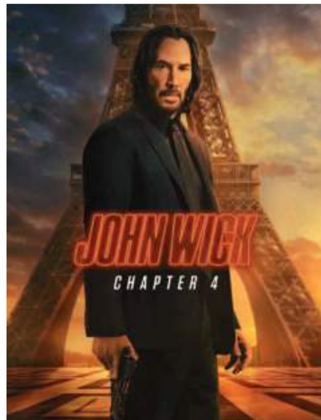
Po prawie czterech latach oczekiwania do kin trafiła czwarta część przygód o Johnie Wicku

Izabela TOMASZEWSKA izatam4@st.amu.edu.pl