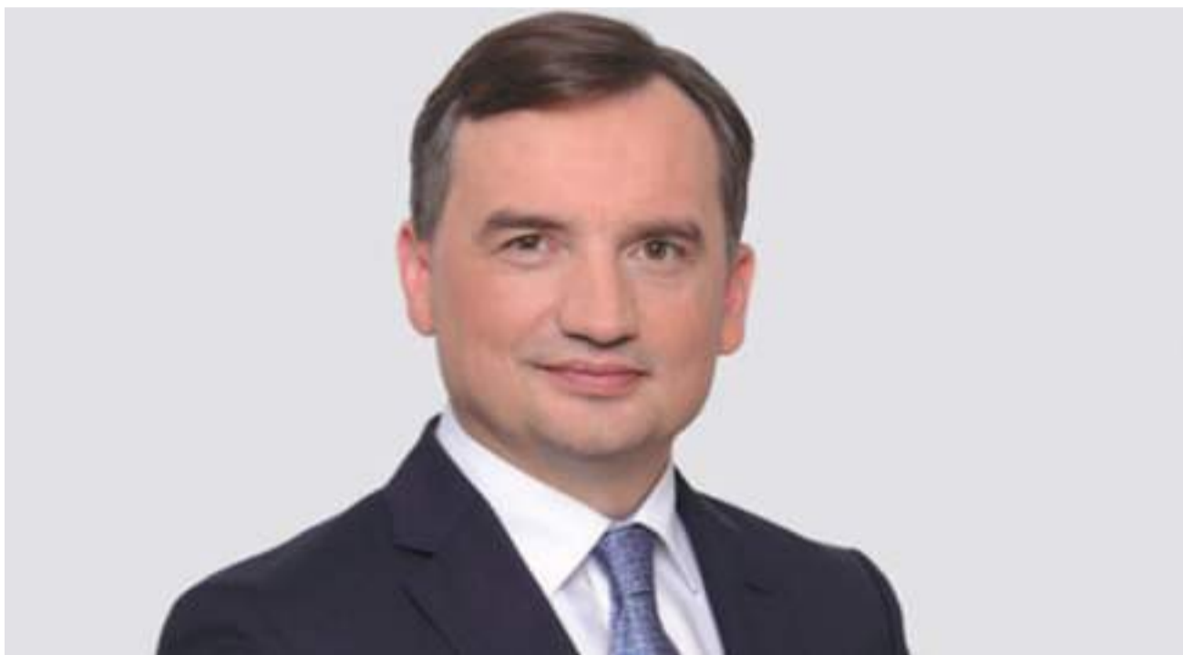
To będzie decydujący rok dla Zbigniewa Ziobry i jego partii

Październikowe wybory zadecydują o kierunku rozwoju partii politycznych oraz o przyszłości całej Polski. Niektóre spośród partii będą musiały polegać na koalicjantach. W tym również na pojedynczych politykach. Jeśli Solidarna Polska wystartuje w wyborach sama, będzie mogła liczyć na „Ziobro” postów.