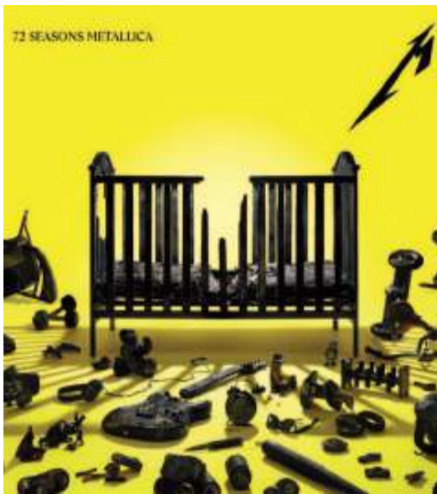
Okladka „72 Seasons”

Nie oznacza to jednak, że na dwunastym albumie Metaliki brakuje energii i mocy. Nawet te utwory, które utrzymane