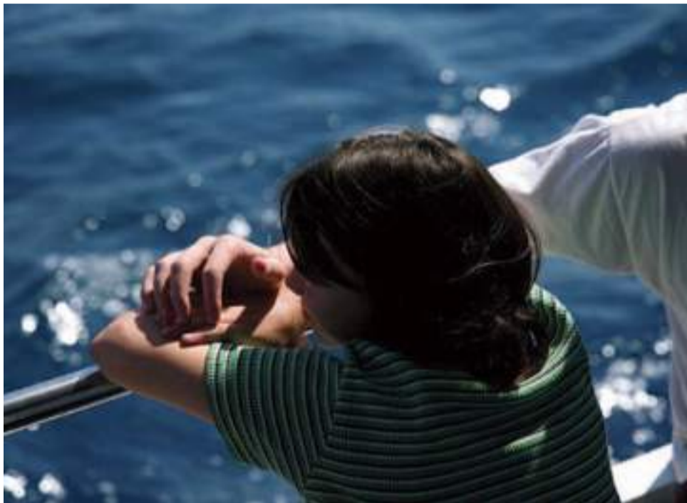
Jeden z kadrów, na którym to główna bohaterka wpada w zadumę, towarzysząc również i oglądającym film!

wiadczać serii „Rodziny się nie wybiera”, gdzie w trakcie dialogu najwyraźniej wskazane mają być konteksty filmowych rodzin. Wydawało mi się to całkiem ciekawe pod kątem tego, jak prowadzący może kierować nurtem rozważań. Zanim jednak opowiem o formie wspólnego filmowego dialogu, muszę opowiedzieć co nieco o filmie.