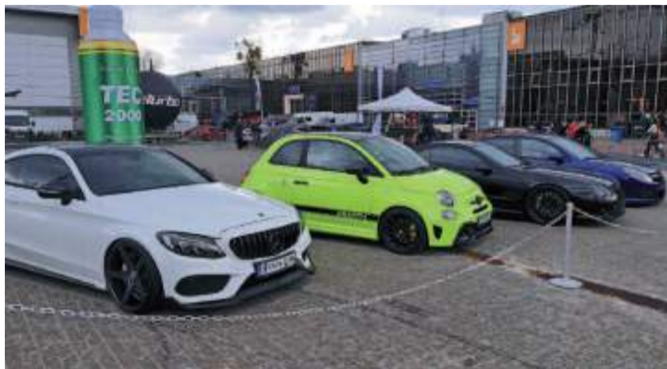
Mimo trudności Poznań Motor Show bardzo dobrze się trzyma.

Jeżeli był jakiś temat główny tegorocznej edycji poznańskich targów motoryzacyjnych, to niewątpliwie była nim elektryfikacja. Niemal na każdym stoisku widzowie mogli zobaczyć z bliska, a niekiedy nawet wejść do środka modeli na prąd. Dotyczyło to nie tylko zwykłych aut osobowych – oglądać można było chociażby elektryczne samochody dostawcze, a także elektryczne wersje marek luksusowych, takich jak Mercedes. Niektórzy wystawcy pokazali natomiast wyłącznie modele elektryczne, wśród których wymienić należy producentów z Chin: Maxusa i Skywellę.