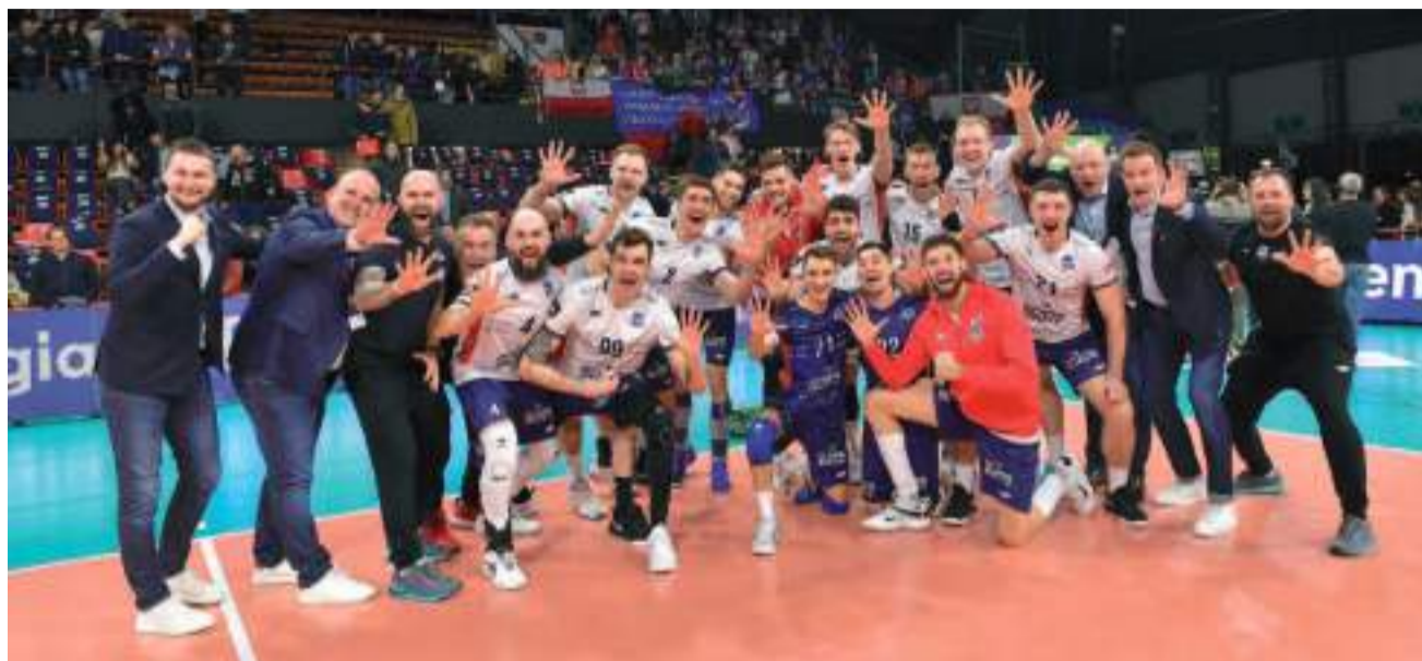
Zwycięski zespół ZAKSY Kędzierzyn-Koźle po półfinale z Perugią

tal przez Jastrzębski Węgiel przegrany, a awans do finału był słodko-gorzki, lecz nie zmienia to faktu, że siatkarze tego klubu swoimi czynami napisali piękną historię.