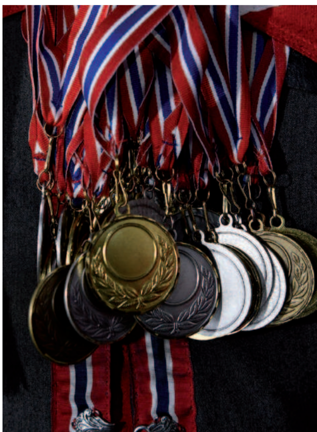
– Norwegowie na MŚ w narciarstwie klasycznym i biathlonie zdobyli 40 medali

Jarl Magnus Riiber to najlepszy kombinator norweski ostatnich lat. Konkurencja polegająca na oddaniu jednego skoku, a