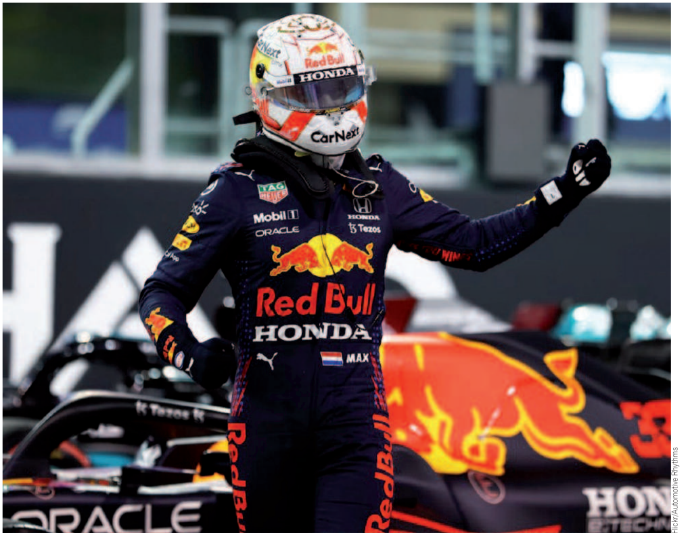
Zespół Red Bull Racing zdominował dwie pierwsze rundy nowego sezonu

Przedsezonowe testy rozbudziły apetyty spragnionych emocji kibiców, a dwa pierwsze wyścigi pokazały, że tegoroczne zmagania w Formule 1 będą bardzo wyrównane. Królowa motorsportu powróciła po prawie czteromiesięcznej przerwie, a Max Verstappen i Sergio Perez już zdążyli pokazać rywalom, że walka o tytuł mistrza świata rozstrzygnie się między nimi.