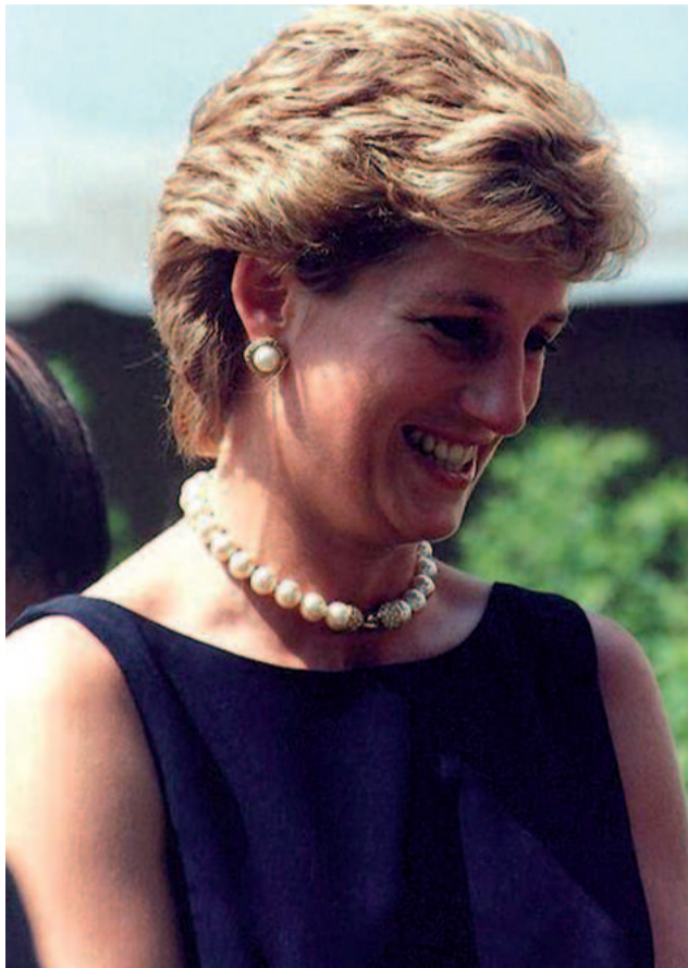
Księżna Diana w wizytę w Rosji w 1995 roku

Jej doświadczenia sprawiły, że była otwarta na życie poza murami królewskich posiadłości. Dowodem na to mogła być pierwsza oficjalna podróż księżnej do Australii w 1983 roku, dwa lata po ślubie z ówczesnym księciem Walii, obecnie królem Karolem III. Podbiła serca wszystkich – matki pokochały ją za opiekuńczość względem syna Williama, którego zabrała ze sobą, jednocześnie łamiąc dotychczasową tradycję zostawiania dzieci w Wielkiej Brytanii. Australijscy republikanie z premierem Bobem Hawke na czele, wtedy niechętnie nastawieni do mo-