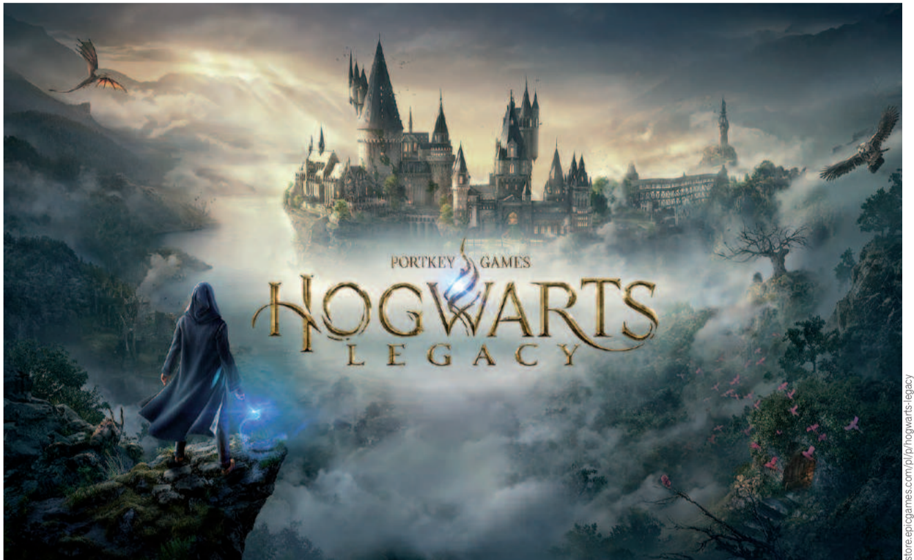
Oktładka gry „Hogwarts Legacy”

Do dyspozycji gracza jest otwarty świat, w którym znajdują się tytułowy Hogwart, Hogsmeade oraz inne wioski. Cała kraina wypełniona jest zadaniami pobocznymi oraz opcjonalnymi