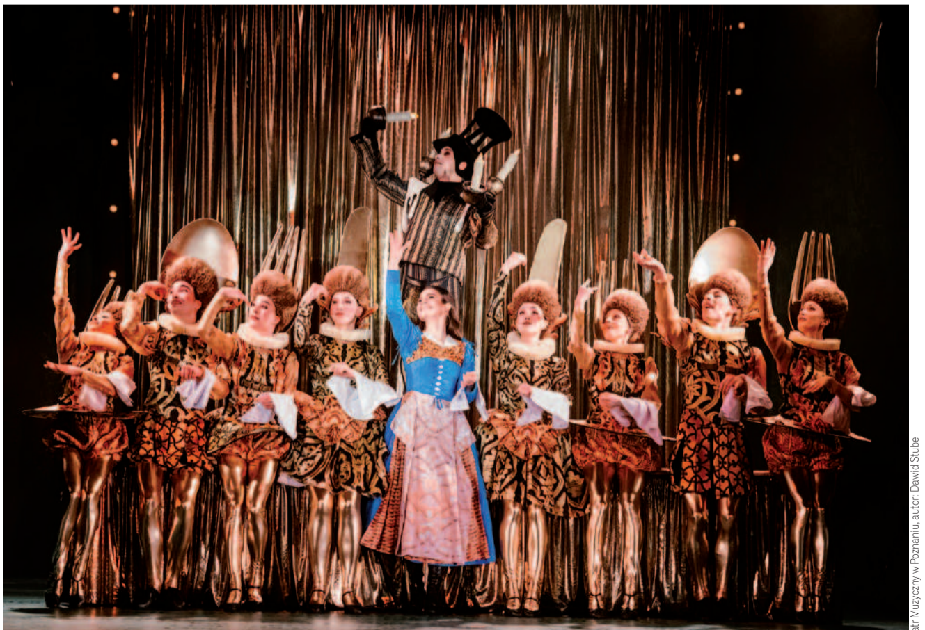
Rewia sztuczków rodem z kabaretu to jeden z najbardziej zapadających w pamięć momentów poznańskiej adaptacji „Pięknej i Bestii”

Bartosz KABACIŃSKI barkab1@st.amu.edu.pl