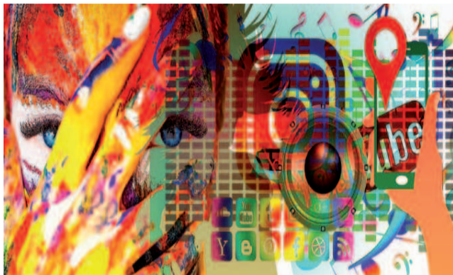
Moc social mediów

Z mojego doświadczenia wynika, że Instagram jest najbardziej pomocny, jeśli potrzeba odzewu innych. Facebook odchodzi do lamusa. Zadałam parę pytań za pomocą ankiet na Insta Stories i poprosiłam zainteresowanych o udzielanie odpowiedzi. Oczywiście wszystko pod przysięgą anonimowości. Z tego miejsca bardzo dziękuję każdemu, kto wziął udział w moich „badaniach” – brzmi to bar-