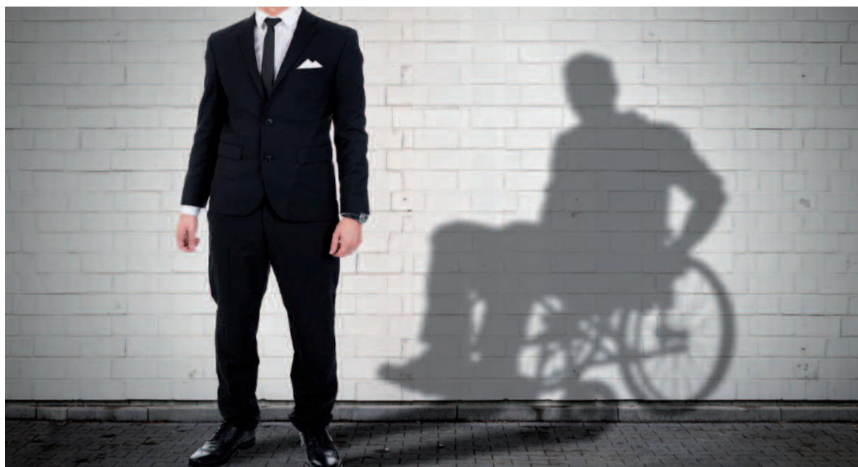
Nie każda niepełnosprawność jest widoczna

zrobić. Nie umiesz się skupić na nauce, masz problemy z przyswajaniem materiału? Jesteś gorszy. Masz problemy z podstawowymi, codziennymi czynnościami, jak mycie się albo zrobienie zakupów? Weź się w garść, inni nie mają takich problemów. Świadomie czy nie, prowadzi nas to nieuchronnie w stronę ableizmu, czyli dyskryminacji osób z niepełnosprawnościami. Bowiem, aby przyznać komuś lekki stopień niepełnosprawności, musi być on osobą o naruszonej sprawności organizmu, która w znacznym stopniu obniża jej zdolność do wykonywania pracy. Im bardziej jest naruszona sprawność organizmu, tym wyższy stopień niepełnosprawności się otrzymuje.