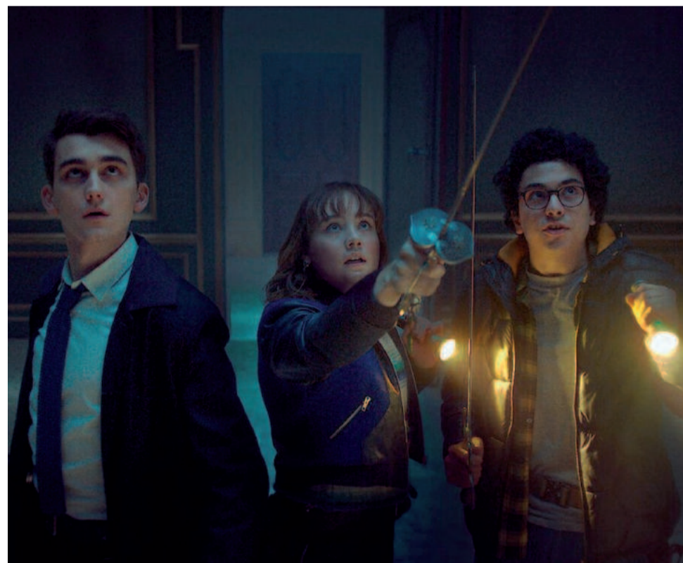
Kadr z serialu „Lockwood & Co”