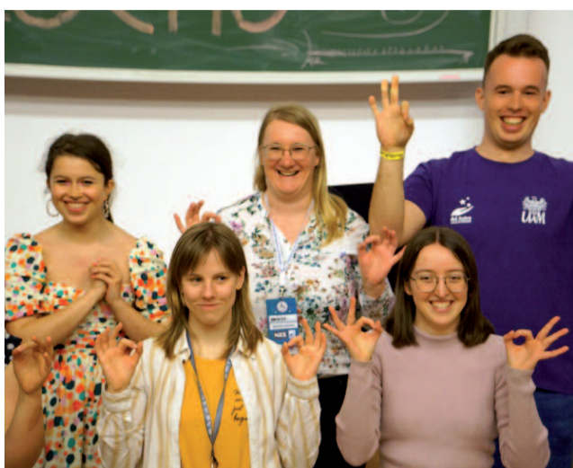
Migamy piosenkę „Kocham wolność” zespołu Chłopcy z Placu Broni

We wtorek 9 maja na kampusie Ogrody, Towarzystwo Tłumaczy i Wykładowców Języka Migowego GEST przygotowało dla nas szereg wydarzeń. Na początku odbył się wykład dotyczący kultury Głuchych, podczas którego dowiedzieliśmy się więcej