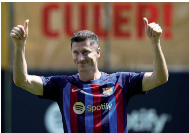
Lewandowski wraz z kolegami z drużyny zdobył mistrzostwo Hiszpanii