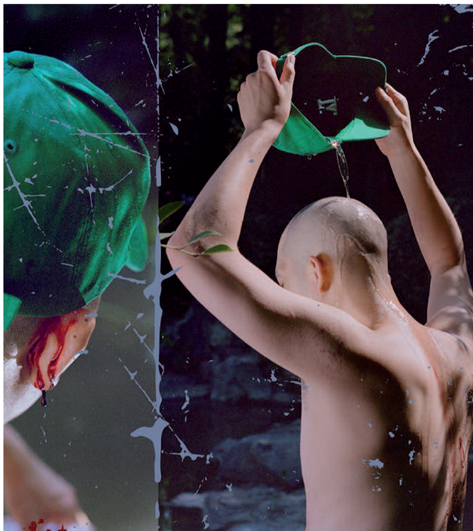
Zielona czapka obowiązkowo pojawia się na okładce

tym albumie brakuje, ale wraz z kolejnymi odsłuchaniami utworów ta myśl bledła. W poprzednich wydaniach Tzusinga żaden utwór nie był na tyle słabszy od innych, aby go pominąć. Spośród dwunastu kawałków na „Green Hat” ginie chociażby „Muscular Theology” czy „攬致悟 (Wear Green Hat)”. Największą różnicą, jaką zauważyłam pomiędzy dotychczasową twórczością muzyka a nowym albumem, jest trochę lżejsze brzmienie. Trylogia „A Name Out of Place” i album „Dongfang