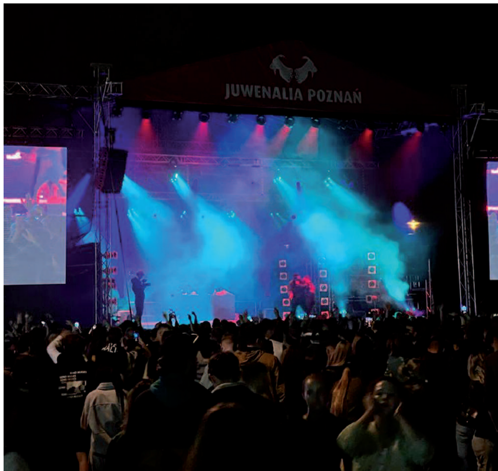
Tłumy pod juwenaliową sceną