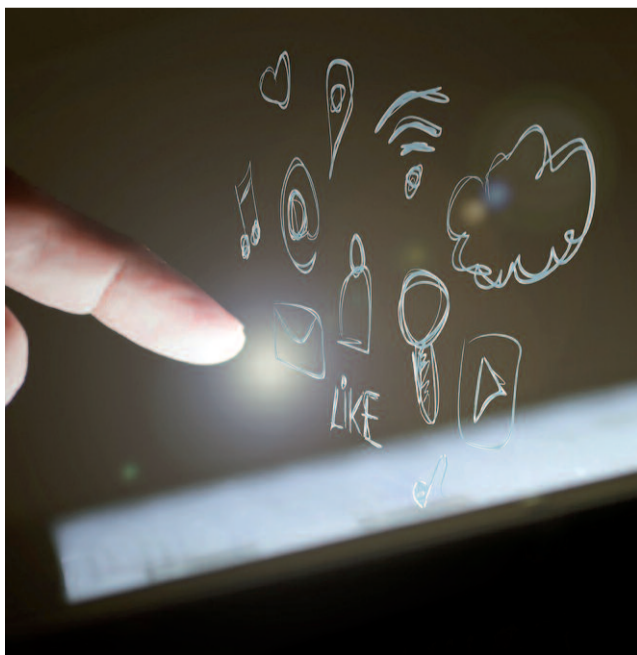
Media społecznościowe mogą być czasem zagrożeniem