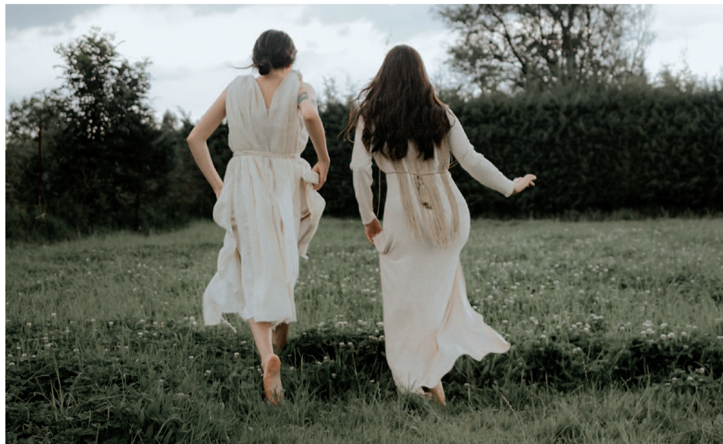
Łąki i zwiewne sukienki - to tym też charakteryzuje się cottagecore