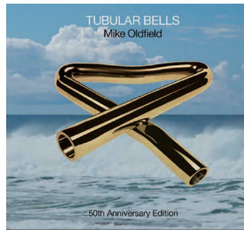
Okladka rocznicowego wydania nawiązuje do pierwszej edycji „Tubular Bells” - charakterystyczna zagięta rura tym razem jest złota

„Tubular Bells” to album dwuczęściowy, z których każda trwa prawie pół godziny. Daje więc to niemal godzinną, szaloną muzyczną podróż, gdzie wszystko zmienia się jak w kalejdoskopie. Ten album prezentuje niemal cały przekrój ówczesnie nagranej muzyki. Znajdziemy tu zarówno nawiązania do muzyki klasycznej oraz ludowej, rocka, bluesa, metalu, rozwijającej się dopiero elektroniki, ale też awangar-