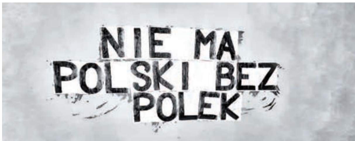
Antyprzemocowe hasła na poznańskich murach