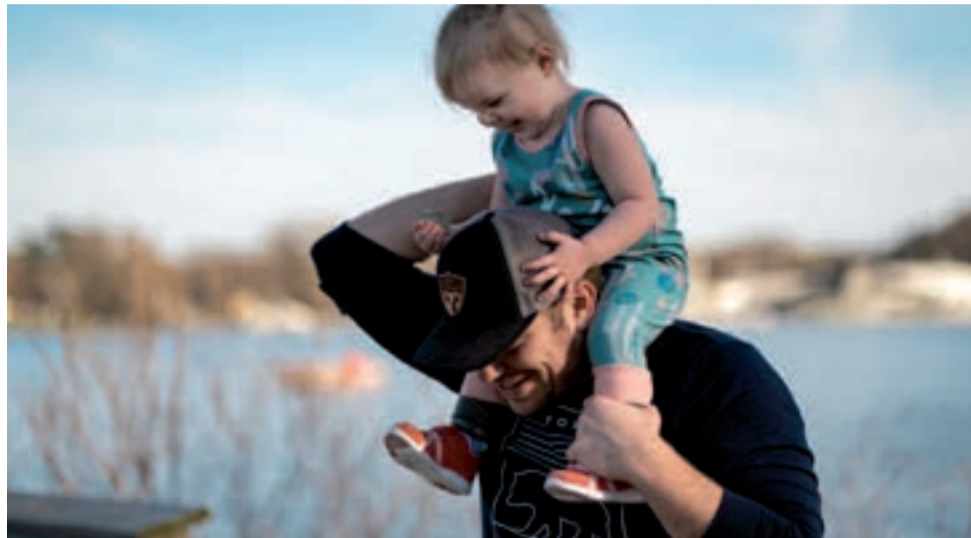
Dzień Ojca to międzynarodowe święto, podczas którego okazujemy tatom wdzięczność za ich wsparcie.

Bardzo interesujący jest również sposób świętowania Dnia Ojca w Niemczech. Vatertag to dzień wolny od pracy, obchodzony we Wniebowstąpienie Pańskie, czyli 40 dni po Wielkanocy. Jego tradycja sięga aż XVIII wieku i wywodzi się od procesji chrześcijańskich Wniebowstąpienia. Wówczas mężczyźni, który miał najwięcej dzieci w wiosce, przewożono na główny plac w wozie, a burmistrz przyznawał mu nagrodę. Zwykle był to kawał szynki. Później element religijny zanikł. Pozostały jednak piesze męskie wyprawy z piwem