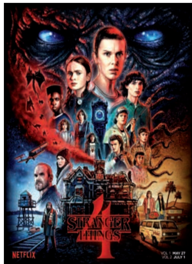
Oficjalny plakat serialu Netflix