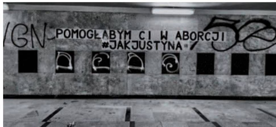
Antyprzemocowe hasła na poznańskich murach

Dwa miesiące temu napisała do nas dziewczyna, która wyraziła chęć działania. Bardzo skrupulatnie sprawdzam profil każdej osoby przed dołączeniem do grupy. Sprawdziłam jej social media – jedno konto zostało stworzone „pod nas”, a drugie było laurką dla Krzysztofa Bosaka. Stwierdziłam jednak, że nie będę jej pochopnie oceniać i zaprosiłam ją na rozmowę. Zachowywała się bardzo dziwnie i nie odpowiadała na moje pytania. Szła w zaparte mówiąc, że jej znajomi plakatuja i bardzo chce być częścią ruchu. W mojej głowie zapaliła się czerwona lampka, gdy spytała, czy może podpisywać plakaty z imienia i nazwiska. Na koniec cztery razy powtórzyła, że dzisiaj koniecznie muszę dodać ją do grupy.