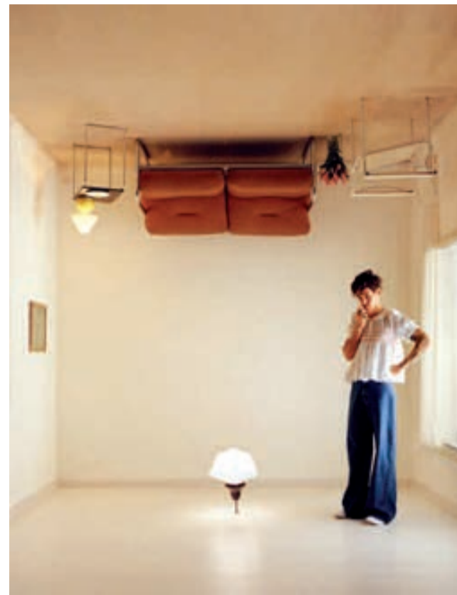
Okładka „Harry's House”

Wraz z wydaniem albumu pojawiło się także wiele fanowskich teorii. Jedną z nich dotyczy kolejności, w której powinno się słuchać całego albumu. Według niektórych, należy zacząć od samego końca, czyli utworu „Love of my life”, dzięki czemu każdy kolejny kawałek nabiera jeszcze większego sensu. Potencjalną wskazówką do tego może być sama okładka albumu, która jest przecięciem do góry nogami. Fanom nie umknęły również podobieństwa między piosenkami z albumu a innymi utworami. „Music from a sushi restaurant” przypomina „Exceptional” Chiny Annie McClain, „Late night talking” zawiera podobieństwa do „Levitating”, którego autorką jest Dua Lipa, a początek „Grapejuice” kojarzy się z „When I'm Small” zespołu Phantogram. Gdy się nad tym zastanowić, nie jest to wcale dziwne, ponieważ coraz częściej zdarza się, że melodie w muzyce się powtarzają – nie są identyczne, jednak bardzo do siebie podobne. Mając na uwadze to, jak dużo nowych utworów