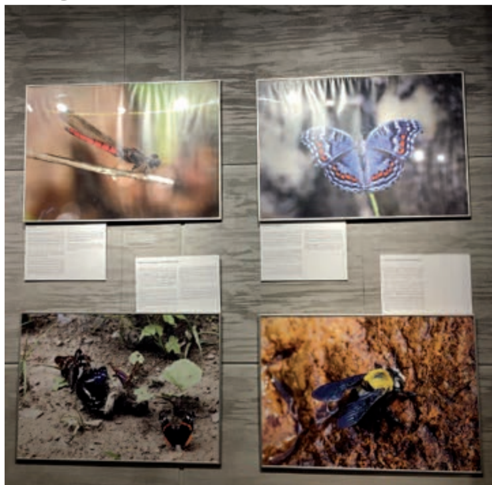
Wystawa nosi tytuł „Istota piękna”

Będąc na wystawie w Centrum Kultury Zamek, spoglądałam na zdjęcia i nachodzi mnie myśl: wcale nie różnimy się od nich wiele. Chcąc się zakamuflować, wkładamy szare bluzy z kapturem. Liczymy wtedy, że inne osobniki dadzą nam spokój. Kiedy chcemy się wyróżnić, sięgamy po żywsze kolory. Chcąc podkreślić swój wizerunek, decydujemy się na obecność ciał obcych, jak kolczyki czy sztuczne rzęsy. Oglądając telewizję, zachwyca się metamorfozami w modowych programach, w których z gąsienicy ktoś zmienia się w pięknego motyla.