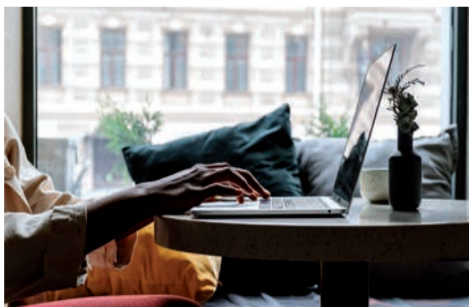
Podcasty towarzyszą nam już na każdym kroku

Najpopularniejszy polski podcast. Każdy odcinek trwa średnio 30 minut, a tematy są przeróżne. Jak mówi sam autor: „Posłuchaj o seryj-