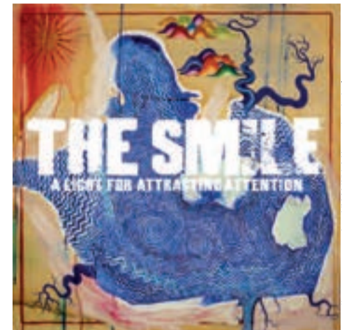
Okładka albumu „A Light for Attracting Attention” grupy The Smile

Przedostatnim, dwunastym utworem na liście jest „We Don't Know What Tomorrow Brings”, który również powstał z wykorzystaniem syntezatorów, choć w zupełnie inny sposób niż poprzednicy. Jest to piosenka znacznie zważsza, która brzmi bardziej nowofalowo i może budzić pozytywne skojarzenia z The Cure. Ostatnim utworem, zamykającym album jest „Skirting on the Surface”. Jest to najdłuższy utwór, który fani Radiohead znają jako jeden z koncertowych utworów zespołu, nie posiadający do tej pory oficjalnego wydania. W wersji The Smile „Skirting on the Surface” jest