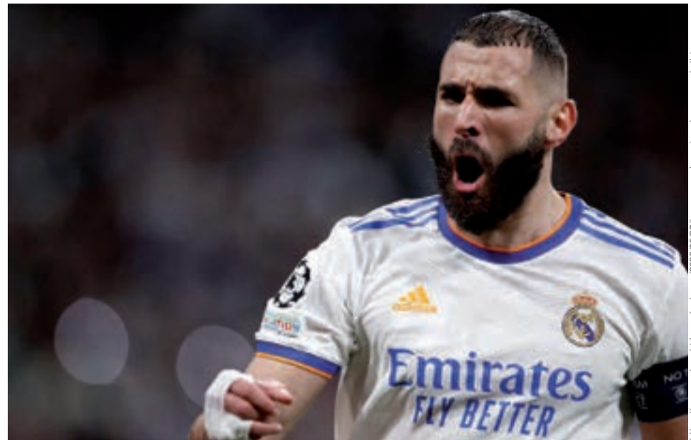
Celebrowający Karim Benzema

Obiektywnie trzeba przyznać, że od momentu zdobycia bramki przez podopiecznych Tuchela pod koniec pierwszej połowy spotkania do Chelsea przeważała w liczbie stworzonych przez siebie sytuacji bramkowych oraz strzałów w światło bramki. Niestety, piłka nożna sprowadza się do zdobywania bramek, a nie do kreowania klarownych sytuacji, z których ostatecznie nic nie wynika. Piłkarze Chelsea przekonali się o tym na początku drugiej połowy, kiedy to Benzema bezlitośnie wykorzystał fatalny błąd bramkarza rywala, notując tym samym hat-tricka na swoim koncie. Tego wieczoru to właśnie francuski striker zbierał najwyższe noty i dał swoim kolegom niemal pewny awans do kolejnej rundy.