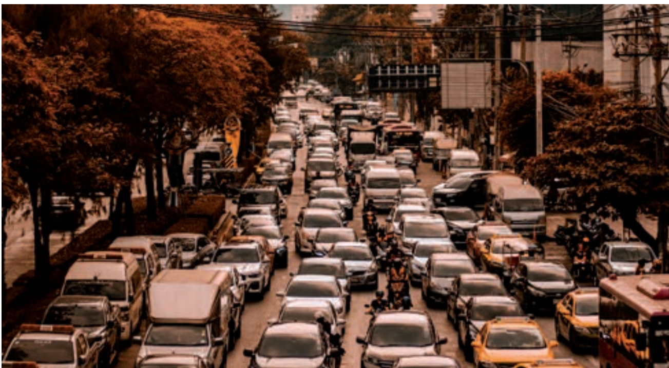
Dzisiaj korki to codzienność w większości miast na świecie