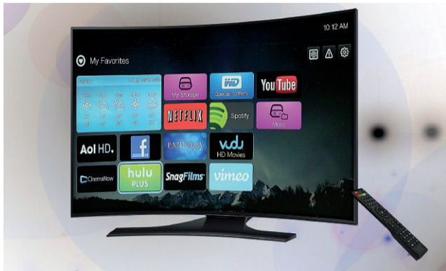
Platformy streamingowe ułatwiają nam dostęp do źródeł filmowych

Dzieło jest utrzymane w mrocznym klimacie. Już początkowe sceny napawają nas niepokojem. Powoduje to u widza napięcie, dzięki któremu nie może oderwać się on od ekranu i musi dokończyć oglądanie filmu za jednym razem. Sama postać