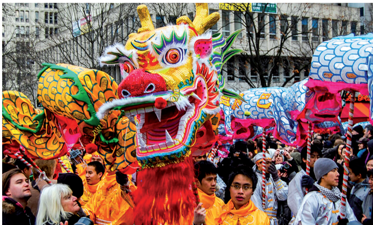
Księżycowy Nowy Rok obchodzony jest nie tylko w Chinach. Na zdjęciu obchody tego święta w Paryżu.

Rok 2022 nazwany został rokiem Tygrysa. Wynika to z chińskiego systemu znaków zodiaków, które w przeciwieństwie do tych znanych nam z Europy przypisane są nie do miesięcy, a do całych lat (przez co, jeśli chcemy sprawdzić nasz chiński zodiak, to musimy poszukać, które zwierzę było patronem roku, w którym się urodziliśmy). Tygrys jest trzecim znakiem chińskiego zodiaku. Oprócz niego występują także inne zwierzęta: szczur (patron roku 2020), bawół (2021), królik (2023), smok, wąż, koń, koza (w