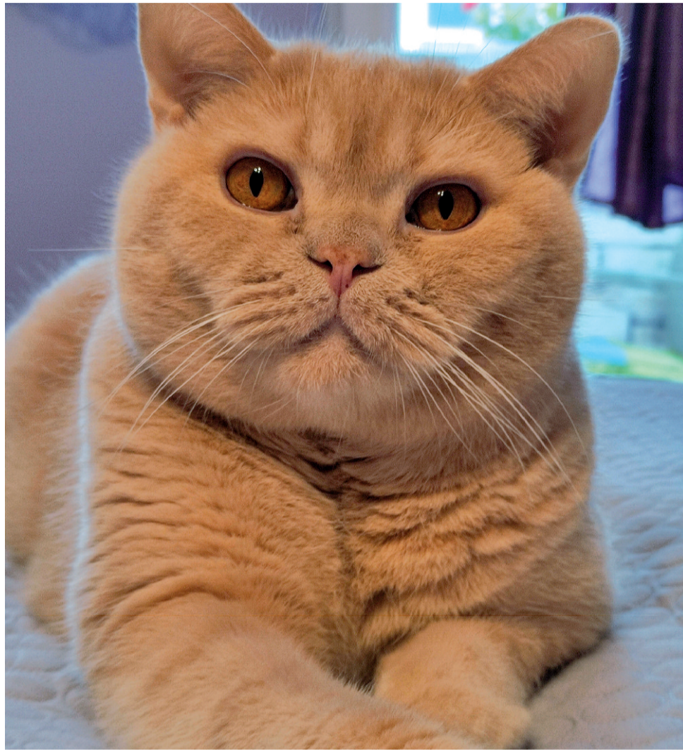
Kot brytyjski krótkowłosej – rasa kota, której początki wywodzą od kotów sprowadzonych na Wyspy Brytyjskie

Koty przez lata były wykorzystywane do tępienia gryzoni i stawały się bohaterami licznych baśni i mitów. W XIX wieku zaś zdecydowano się na sklasyfikowanie i nazwanie ich ras. Zaczęto wtedy organizować wystawy, na których wystawiano tylko trzy rodzaje kotów. Zwiedzający mogli podziwiać otyłe europejskie koty domowe, długowłose koty z Azji Środkowej oraz smukłe z Dalekiego Wschodu.