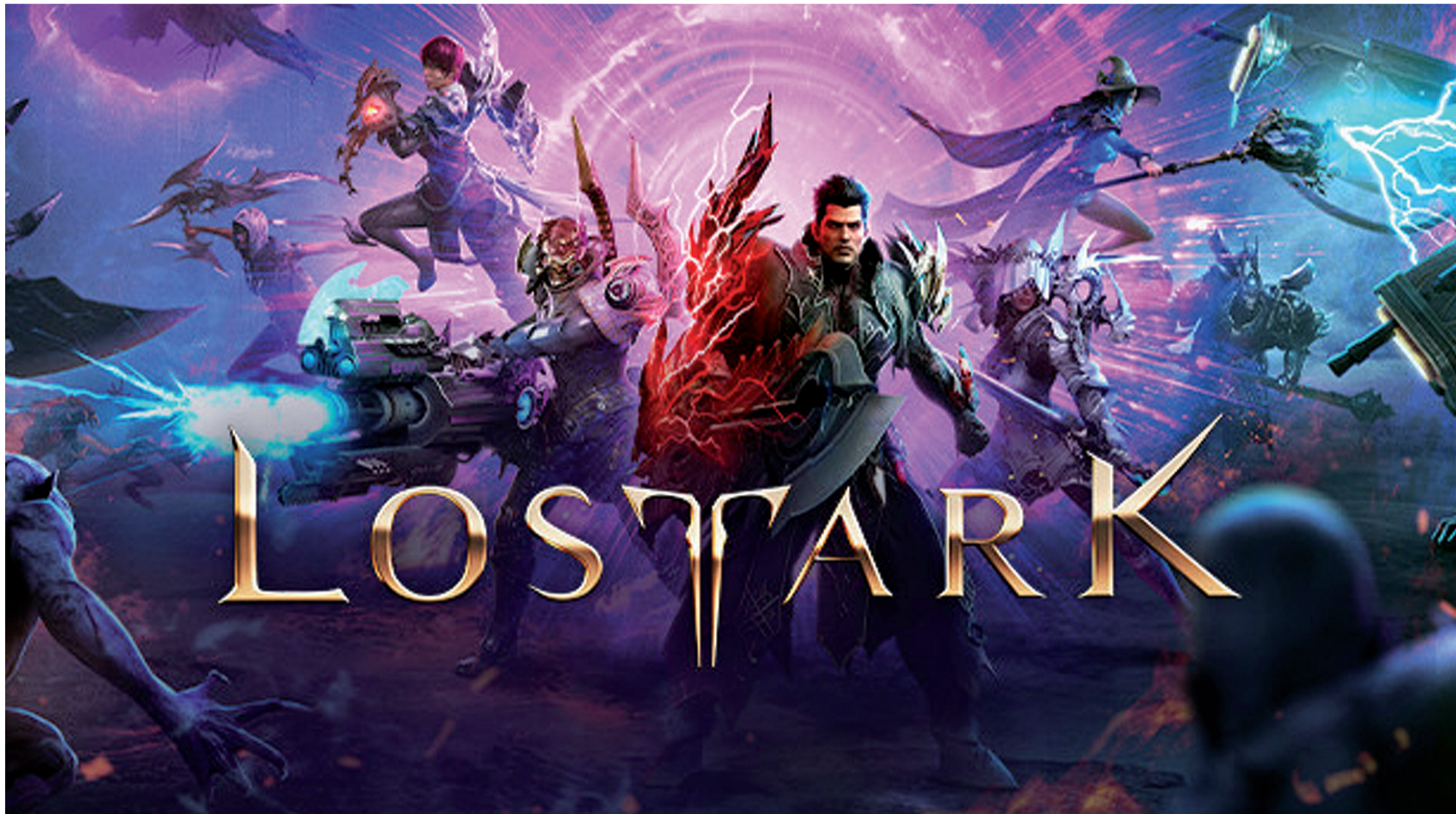
Grafika promująca grę Lost Ark

Lost Ark to nowe MMORPG, które swoją premierę na zachodzie miało 11 lutego 2022 r. Gracze, którzy zapłacili za przedpremierowy pakiet, mogli przetestować produkcję kilka dni wcześniej. Aczkolwiek, aby zagrać w Lost Arka, nie trzeba wydać żadnych pieniędzy, co sprawiło, że już dzień po oficjalnej premierze na serwerach gry przebywało jednocześnie aż 1,3 miliona osób. Gra osiągnęła drugi najlepszy wynik w historii Steama. Czy to oznacza, że jest warta sprawdzenia?