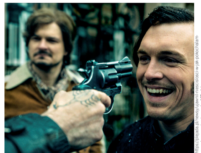
Nikoś – Król Wybrzeża

Wbrew powszechnie panującej opinii film w reżyserii Kawulskiego wywarł na mnie ogromne wrażenie. Wizja ponad trzech godzin spędzonych na oglądaniu polskiej produkcji sensacyjnej na początku przyprawiała mnie o dreszcze, jednak w rezultacie zupełnie nie odczułam mijającego czasu. Zdecydowanie uważam, że jest to film, który niesie za sobą głębokie przesłanie. Zdanie „lepiej jest