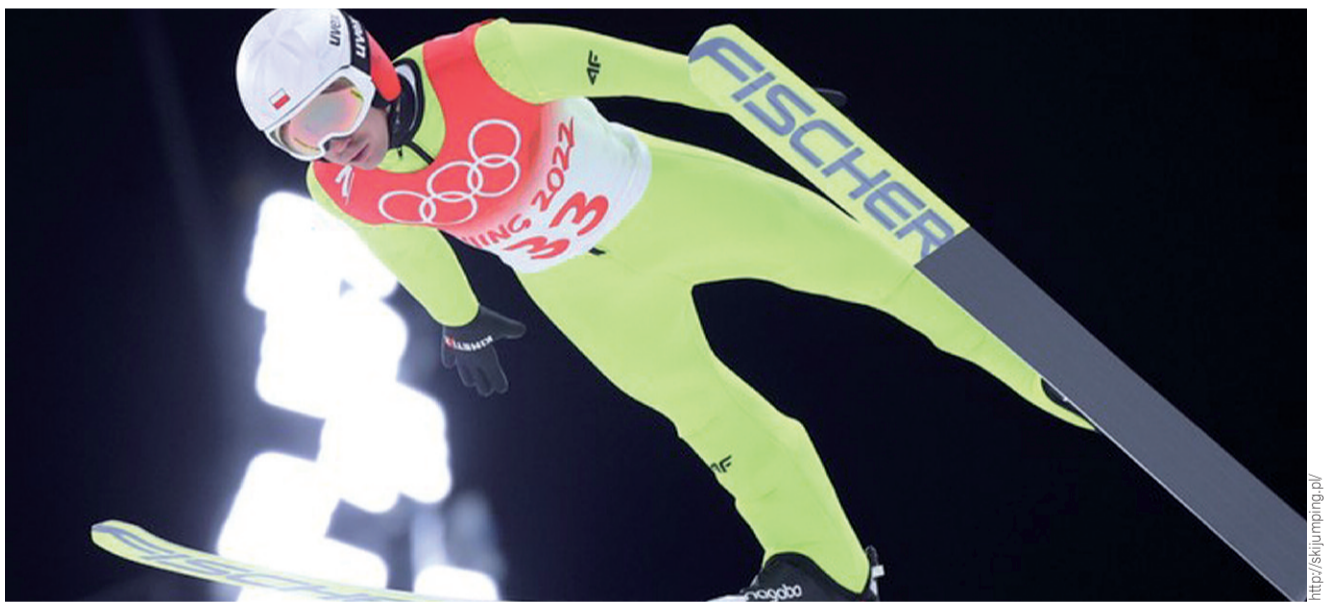
Kamil Stoch na IO w Pekinie

Historia obecnego sezonu i siła rywali studziły nadzieje nawet najbardziej zagorzałych kibiców mistrza. Mimo tego, co przynosiła przeszłość, Stoch po raz kolejny odleciał daleko, a przy tym i pięknie. Nienaganna sylwetka i skok na 137,5 metra dały mu czwar-