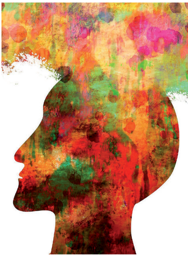
Czy kiedykolwiek czuleś się gorszy i nieustannie porównywałeś się z innymi? Miałeś wrażenie, że twoje życie nie ma sensu?