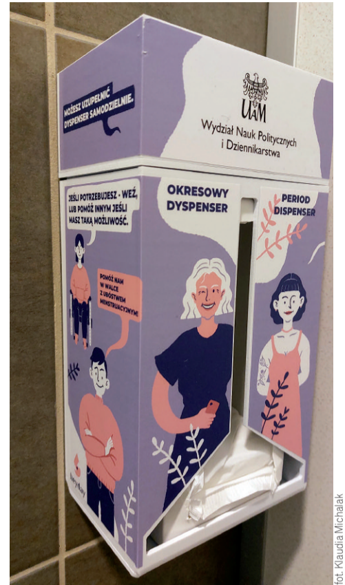
Okresowy dyspenser na WNPiD

Pilotaż na 3 miesiące i 6 dyspensersów sfinansował nasz wydział. Wnioskowaliśmy pilotaż na 3 miesiące, bo stwierdziliśmy, że jest to odpowiedni okres, żeby przeprowadzić, żeby wy badać, jakie jest zapotrzebowanie na wydziale. Nie chcieliśmy kupować środków na rok, nie znając zapotrzebowania, a przykładowo miesiąc jest za krótkim czasem, żebyśmy mogli wyciągnąć wnioski. Sytuacja o stacjonarnych zajęciach jest bardzo dynamiczna, dlatego tym bardziej nie chcieliśmy wybiegać za daleko w przyszłość. Jeżeli chodzi o to co dalej, to my, Globalna Wioska, dziekan i RSS jesteśmy zdania, że jeśli będzie potrzeba i będziemy zmotywowani to prędzej czy później znajdą się pieniądze na kontynuację inicjatyw. Nie wykluczamy aktywizowania społeczności studenckiej, bo jest to projekt, który ma nas zbliżyć do siebie i mobilizować do pomocy innym. Istnieje grupa osób, które potrzebują, żeby te środki były, ale są też osoby, które mogą coś od siebie dać. Przy szatni jest położony karton, do którego można odkładać środki men-