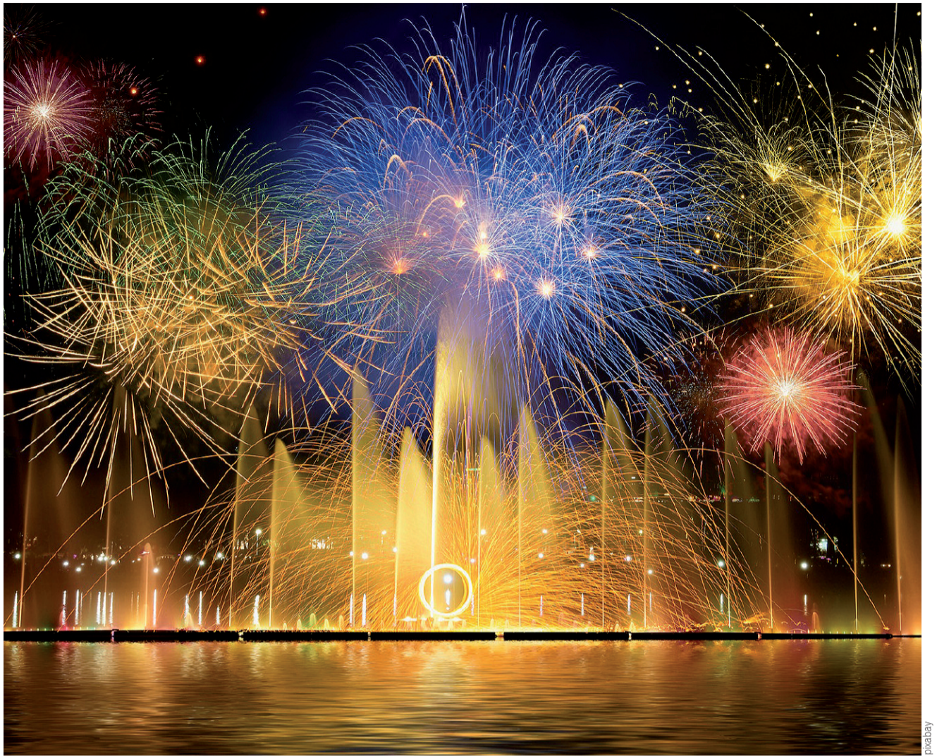
Uroczyste bombardowanie nieba na koniec roku