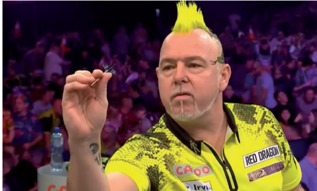
Peter Wright drugi raz w karierze został mistrzem świata

W wielkim finale „Snikebite” grał z Michałem Smithem. Anglik w Alexandra Palace prezentował świetną dyspozycję, eliminując po drodze Jonny'ego Claytona oraz obrońcę tytułu Gerwyna Price'a. Początek ostatniego meczu mistrzostw należał do Wrighta, który szybko wygrał dwa pierwsze sety. Jednak Michael Smith wrócił do gry i nawet wyszedł na prowadzenie 5:4. Lecz w dalszej