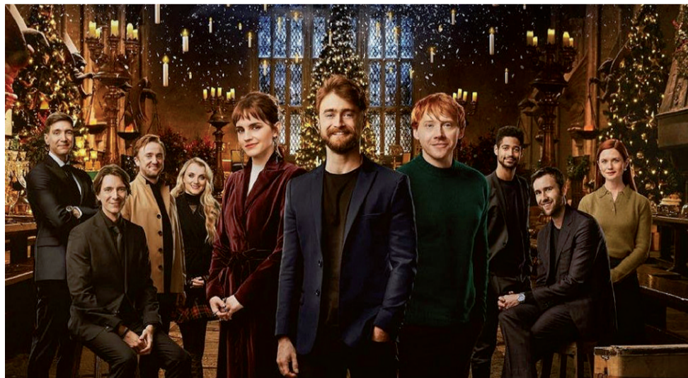
Obsada Harry'ego Pottera w filmie na 20 rocznicę serii