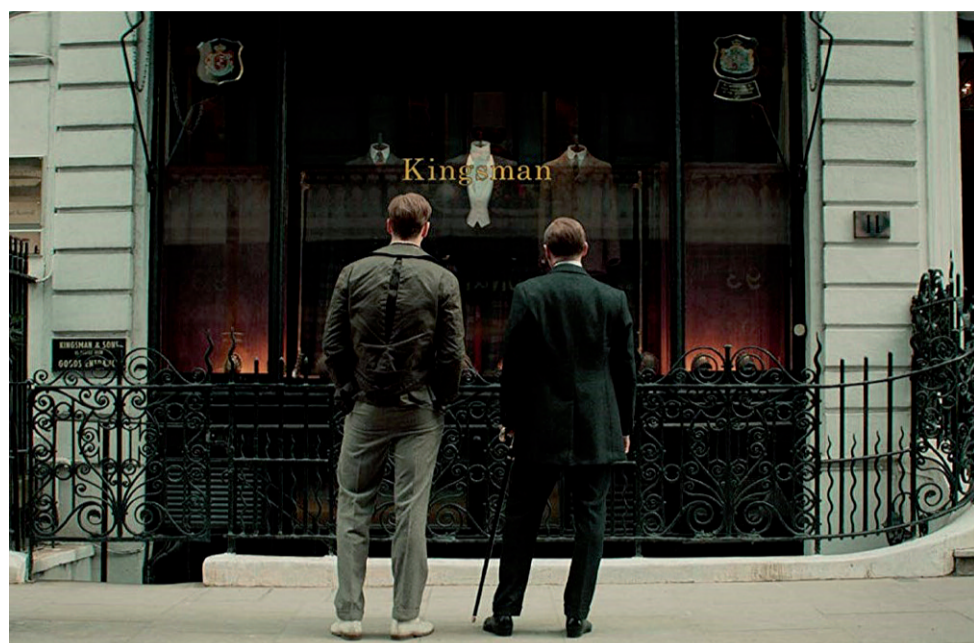
Kadr z filmu „King's Man: Pierwsza misja”

Sceny akcji trzymają widza w napięciu, nie dając chwili na wytchnienie. Vaughn szczególnie popisał się sceną walki z mrocznym Rasputinem, podczas której bohater dosłownie wiruje tanecznym krokiem wokół swoich rywali. Do końca pojedynków nie wiadomo, jaki będzie ich rezultat. Uważam, że fani niebanalnego przedstawienia potyczek nie będą zawiedzeni, są one zdecydowanie zajmujące.