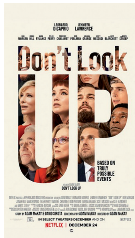
„Nie patrz w górę”