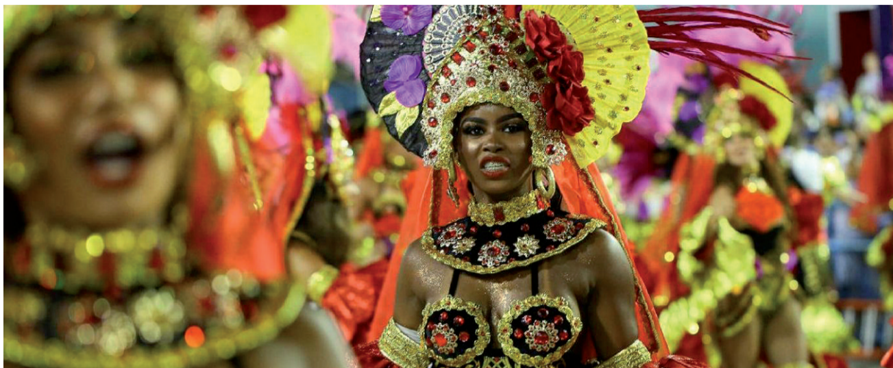
Karnawał w Brazylii

Brazylia jest naprawdę ogromnym krajem i nie sposób odpowiedzieć na to pytanie jednakowo. Wiele zależy od tego, z jakiej jej części pochodzimy. Moje rodzinne strony to samo południe Brazylii, a dokładniej miasto Porto Alegre. Z racji tego, że jest to stolica tego regionu, w centrum miasta organizowane jest coś na wzór Sambodromu, lecz prawdziwa zabawa karnawałowa odbywa się wszędzie, gdzie tylko jest to możliwe, najczęściej jednak dzieje się to po prostu na ulicach miasta. W Brazylii w styczniu mamy środek lata, co pozwala na imprezowanie do białego rana. Obowiązkowo jednak każdy przygotowuje sobie przebranie, możemy to porównać do amerykańskiej tradycji przebrań na Halloween. Jeżeli widzimy grupę ludzi bez specjalnych strojów, to zazwyczaj są to jacyś słabo zorientowani w sytuacji turyści.