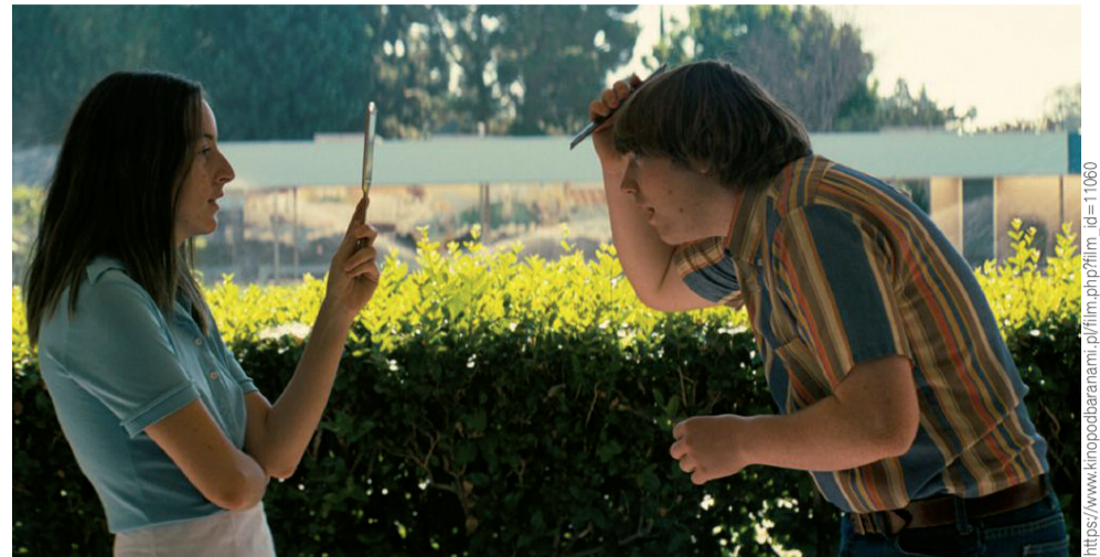
Kadr z filmu

Nie oznacza to, że brakuje w filmie gwiazd. Swoje pięć minut dostali tacy aktorzy jak Bradley Cooper (odtwórca roli rzeczywistej postaci – Jona Petersa) oraz Sean Penn, tutaj jako kultowy, ale już na pewien sposób zakurzony obiekt westchnień fanek kina. Nie grają długich ról, ale mogą zapewnić, że ich epizody zapadną na długo w pamięć. Cały obraz zresztą bazuje na takich poje-