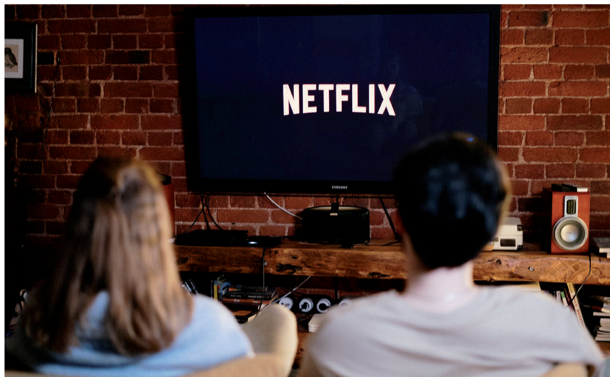
Stereotypy są wszędzie, nawet na Netflixie

Niektóre stereotypy są przekazywane z pokolenia na pokolenie, są przyjmowane na wiarę, nawet bez sprawdzania. Chodzi tu o stereotypy płci, a mianowicie to, że mężczyzna może tylko zarabiać pieniądze, wbijać gwoździe w ścianę i pić piwo przy telewizorze, póki jego żona gotuje kolację, sprząta całe miesz-