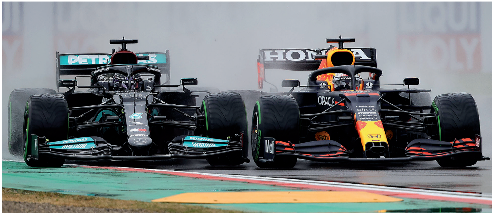
Max Verstappen (z prawej) i Lewis Hamilton (z lewej) stoczyli ze sobą zacięty bój o mistrzostwo w 2021 roku

Sezon 2021 Formuły 1 dobiegł końca. Fani w końcu doczekali się bliskiej walki o mistrzostwo między dwoma zawodnikami różnych ekip. Jednak to, jak kandydaci do tytułu ze sobą walczyli pozostawia sporo do życzenia. Ze względu na ogrom wydarzeń, najlepiej podsumować ten rok w F1 krótką listą.