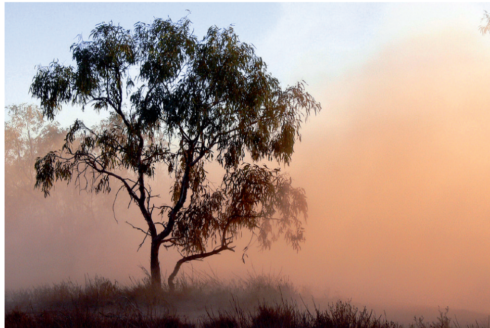
Ciekawy motyw zapachów, ale za mało rozwinięty wątek Alaski