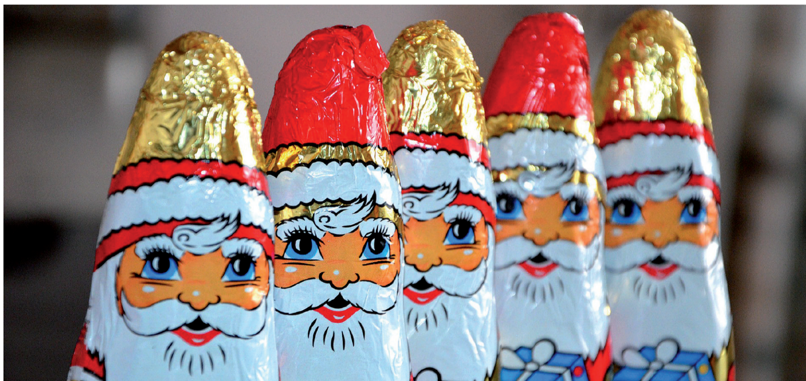
Święty Mikołaj twarzą świątecznej marki

Jak co roku, gdy tylko z marek- tów poznikają znicze, w na- szych głowach, sercach i na billboardach rozpala się świąteczna gorączka. Gorączka zakupowej celebra- cji.