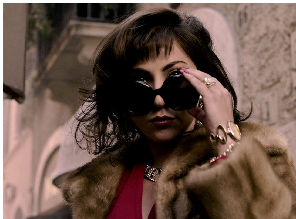
Lady Gaga jako Patricia Reggiani

graną przez siebie postacią. Główną rolę grała Lady Gaga. To jest druga rola filmowa Lady Gagi, która ponownie udowodniła, że jej udział w filmie nie jest dziełem przypadku. To nie tylko genialna wokalistka, ale i bardzo dobra aktorka. Potrafi w pełni oddać graną przez siebie postać. Bardzo dobrze naśladowała akcent Patricii Reggiani (choć co niektórzy zarzucają jej, że akcent był bardziej rosyjski niż włoski). Jest aktorką pla-