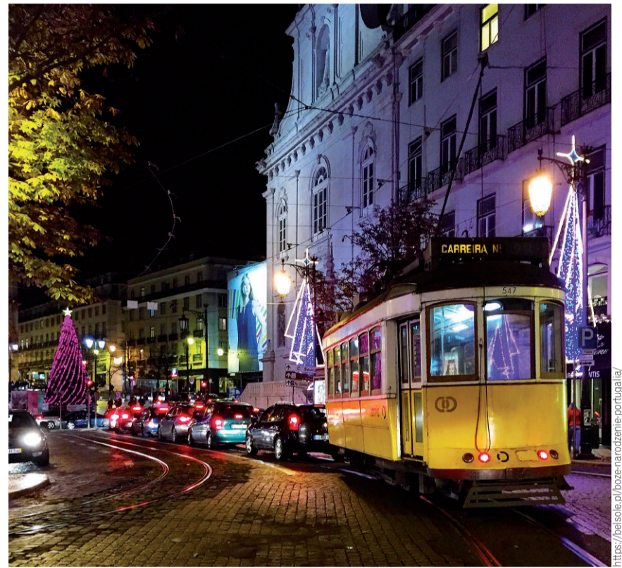
Ulica Lizbony w okresie Bożego Narodzenia

mieszkańcy wspomnianego wcześniej miasta. Każdego roku, na początku grudnia, nieustraszeni młodzi mężczyźni wspinają się na kilkusetmetrowe drzewo i pieczołowicie je dekorują. Warto dodać, iż robią to bez żadnego zabezpieczenia. To ciężka praca, odpowiednia tylko dla tych, którzy są pewni swoich fizycznych umiejętności i lubią ryzyko. Każdego roku drzewo stoi w tym samym miejscu, a tysiące ludzi gromadzi się, aby je zobaczyć. Znajduje się przy wyciągu Santa Luzia, na rogu 25 de Abril Avenida z Rua Doutor Tiago de Almeida i jest prawdziwym obrazem świątecznej radości.