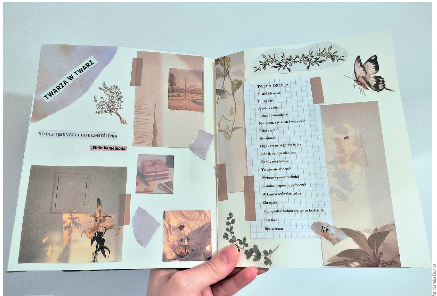
Scrapbooking staje się coraz popularniejszą formą spędzania wolnego czasu.

Najwięcej uroku mają jednak naklejki o różnym charakterze i kształtach, które warto odklejać przy pomocy pęsety, aby nie poniszczyć ich brzegów. Można też zaopatrzyć się w długopisy, pisaki, zakreślacze i markery, które służą do rysowania, kolorowania i pisania w scrapbooku. Mogą to być specjalne pisaki do kaligrafii, takie jak brush pens.