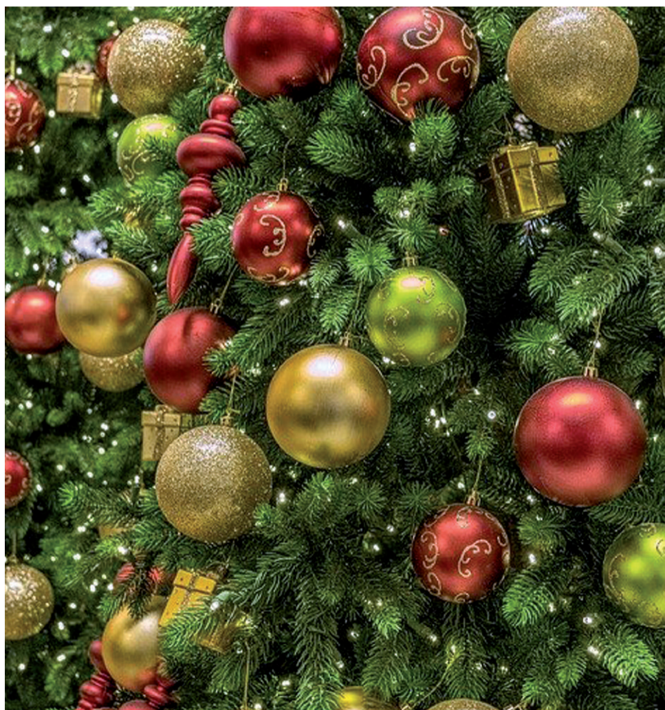
Święta Bożego Narodzenia to wyjątkowy czas

Na przestrzeni lat sposób celebrowania bardzo się zmieniał. Początkowo miał on charakter zadumy, teraz uroczystości wigilijne i czas przed