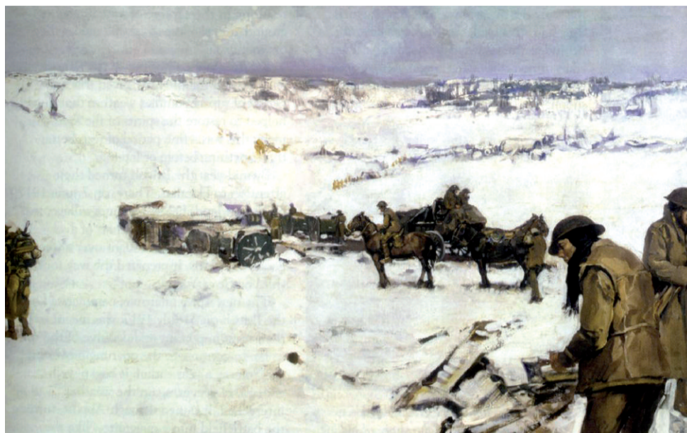
Zima na froncie Wielkiej Wojny

Kolejnym ważnym czynnikiem był fakt, że dla większości młodych rekrutów były to pierwsze święta poza domem. Wojna na tak wielką skalę nie była znana od stulecia w Europie. Większość świata uważała, że wojna skończy się w kilka miesięcy i że młodzi chłopcy „wrócą do domu przed